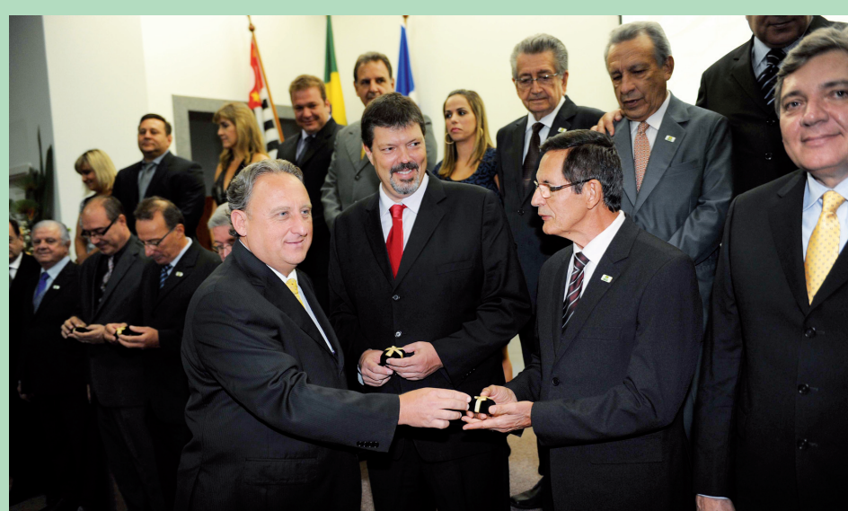
Na cerimônia foram empossados membros da Diretoria, Conselho Deliberativo, Fiscal e Consultivo, sendo entregue a todos as respectivas credenciais