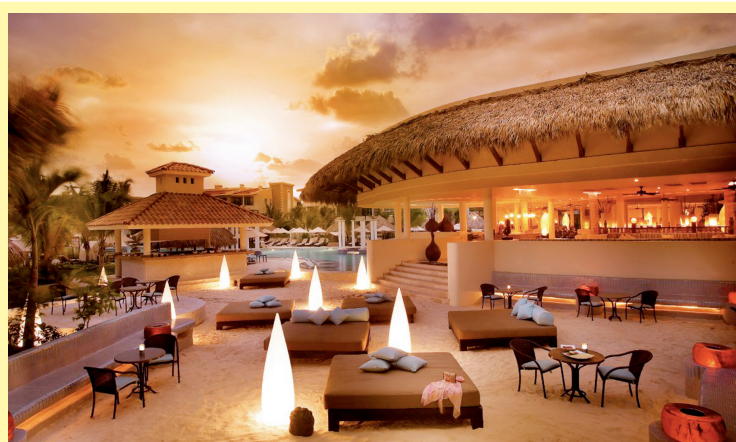
Os resorts são uma opção muito interessante também para lua de mel, desde que os “pombinhos” possam cacifar um hotel mais TOP, como este em Punta Cana

Recomendo que ANTES de fechar uma viagem all inclusive,