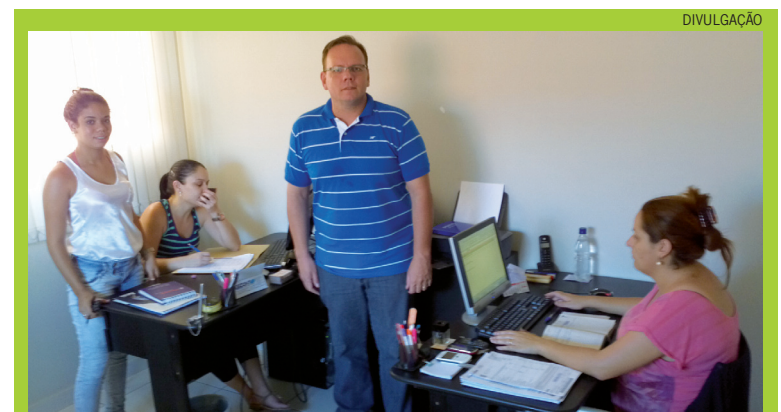
A equipe da Radar Consultoria proporciona um excelente atendimento com responsabilidade e dedicação total ao cliente

do Sales, 141- sala 1, Centro acima. O horário de atendimento é de segunda a sexta-feira, das 7h30 às 18h.