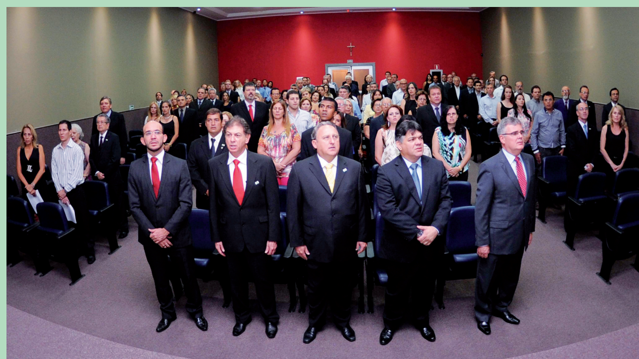
A sessão solene de posse da nova diretoria da ACIL foi realizada no auditório da entidade