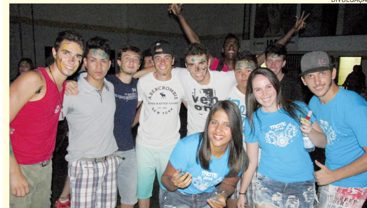
O Trote Solidário ocorreu na noite do dia 10 de fevereiro e todos os alunos – novatos e veteranos – doaram um litro de leite na entrada da faculdade