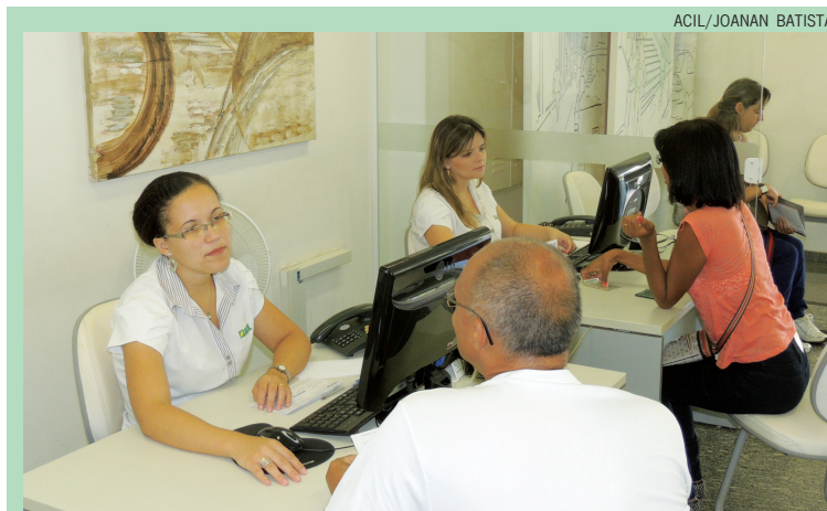
O SCPC da ACIL funciona de segunda à sexta das 8h às 18h, e aos sábados das 8h às 12h

(BVS) e oferece um grande leque, que conta com mais de 50 opções, de prestação de serviços destinados tanto para pessoas físicas quanto para pessoas jurídicas. Além do Certocar, podem ser consultados, por exemplo, a localização de consumidores que estão inadimplentes, a análise de cheques, inclusão e exclusão de clientes do banco de dados de inadimplência, além do serviço de recuperação de crédito, que funciona em parceria com as empresas associadas para que a cobrança e o recebimento desses débitos sejam feitos através da ACIL, e o SOS cheques e documentos, que auxilia e protege o consumidor e o comerciante contra o uso indevido de cheques e/ou documentos roubados ou perdidos. Há também